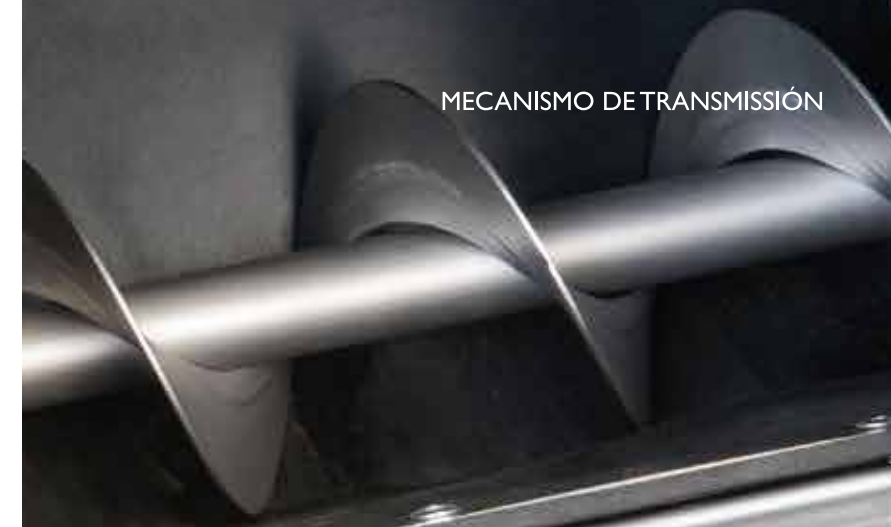
MECANISMO DE TRANSMISIÓN

LA MS SEEDS HA SIDO DESARROLLADA Y TESTADA POR NUESTRO DEPARTAMENTO DE I+D. SU SISTEMA INNOVADOR HACEN DE ELLA UNA MÁQUINA EFICAZ Y CON UNA ALTA AUTONOMIA.