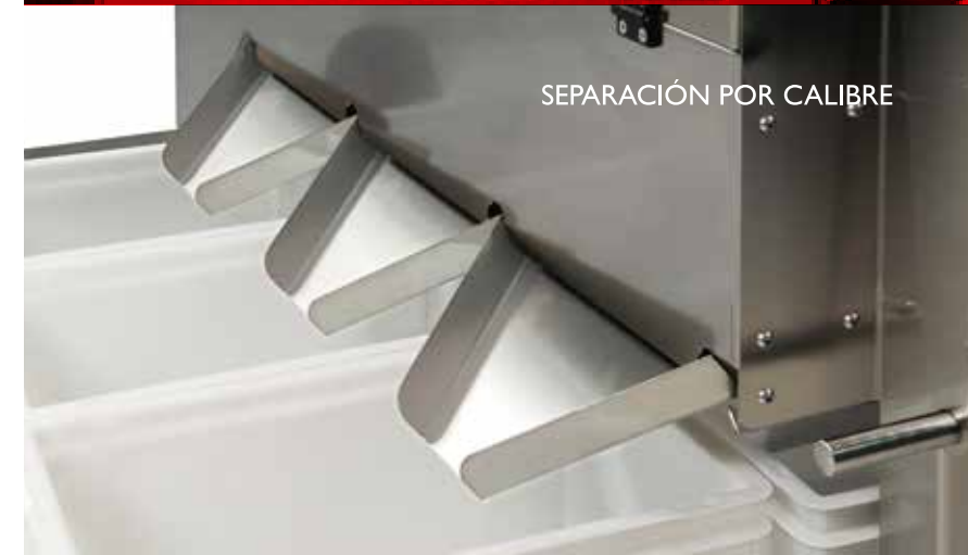
SEPARACIÓN POR CALIBRE