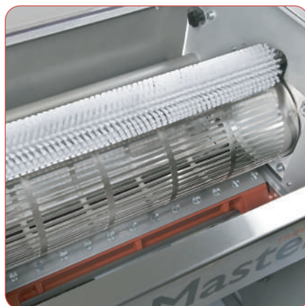
Tambor calibrado para un corte de precisión.