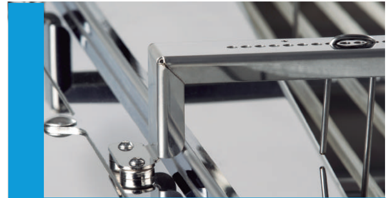
Personaliza los tamaños