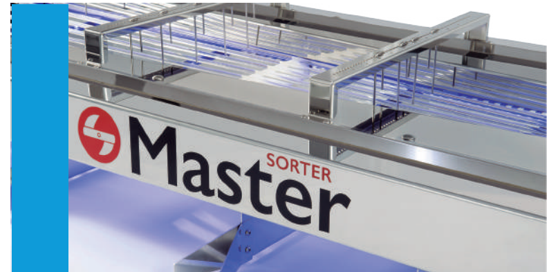
Acero inoxidable par GMP