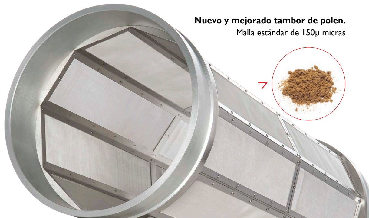
Nuevo y mejorado tambor de polen. Malla estándar de 150µ micras

Diferentes opciones de micraje disponibles. ¡Personalízalo como quieras!